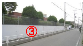
白壁と金網 White wall & wire mesh fence