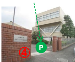
赤レンガの塀 Red-brick wall