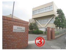
赤レンガの塀 Red-brick wall