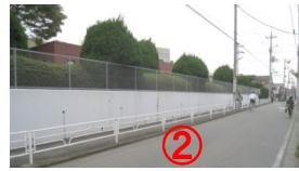
白壁と金網 White wall & wire mesh fence